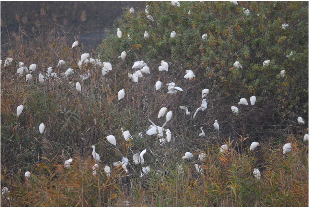
Roost di Aironi guardabuoi