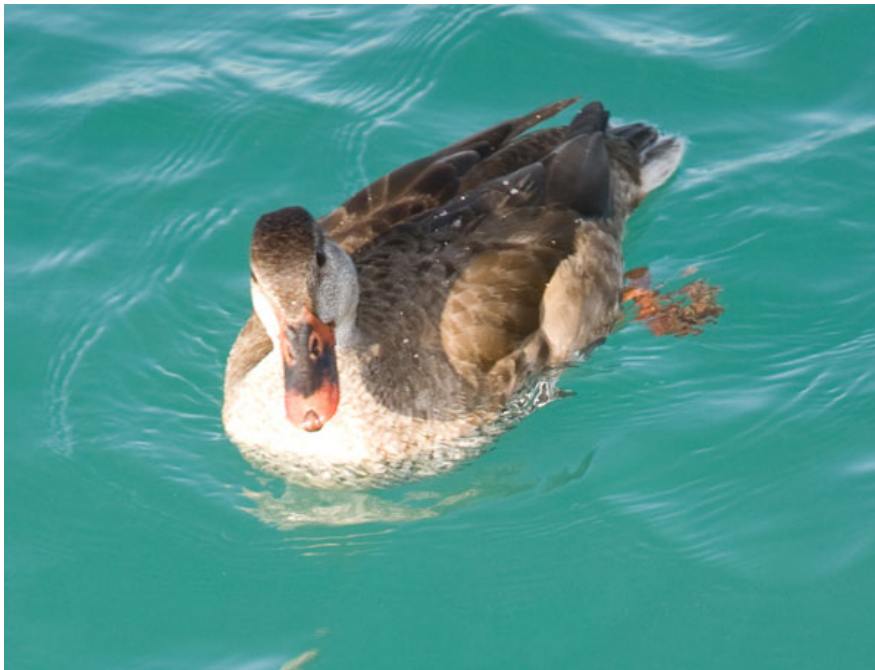
Uno dei due curiosi ibridi Germano reale X Fistione turco (qui l'individuo femmina, l'altro era maschio) osservati sul Medio Lago di Garda (BS0102), gennaio 2009.