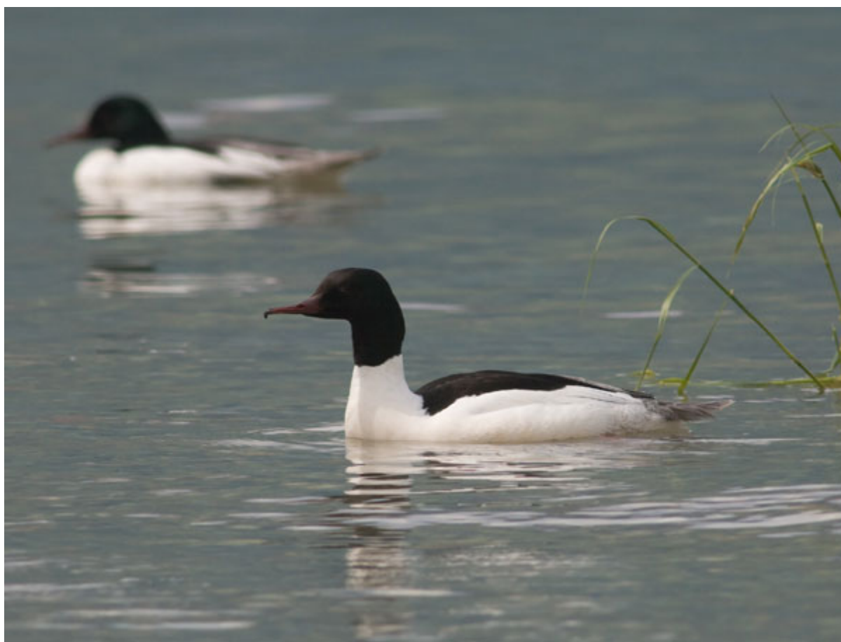
Smerghi maggiori sul Lago Maggiore (VA0400), gennaio 2009