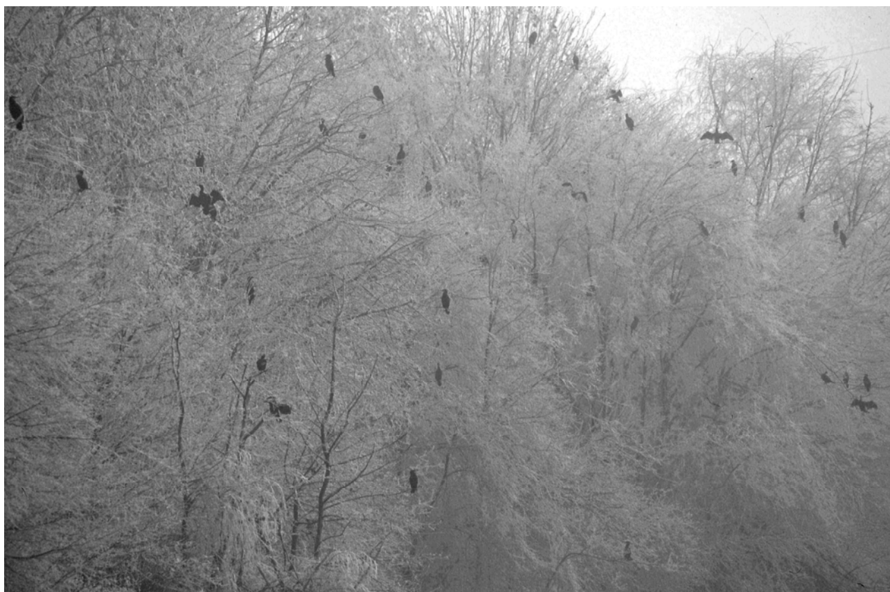
Tramonto al dormitorio di cormorani di Pegognaga, gennaio 2008