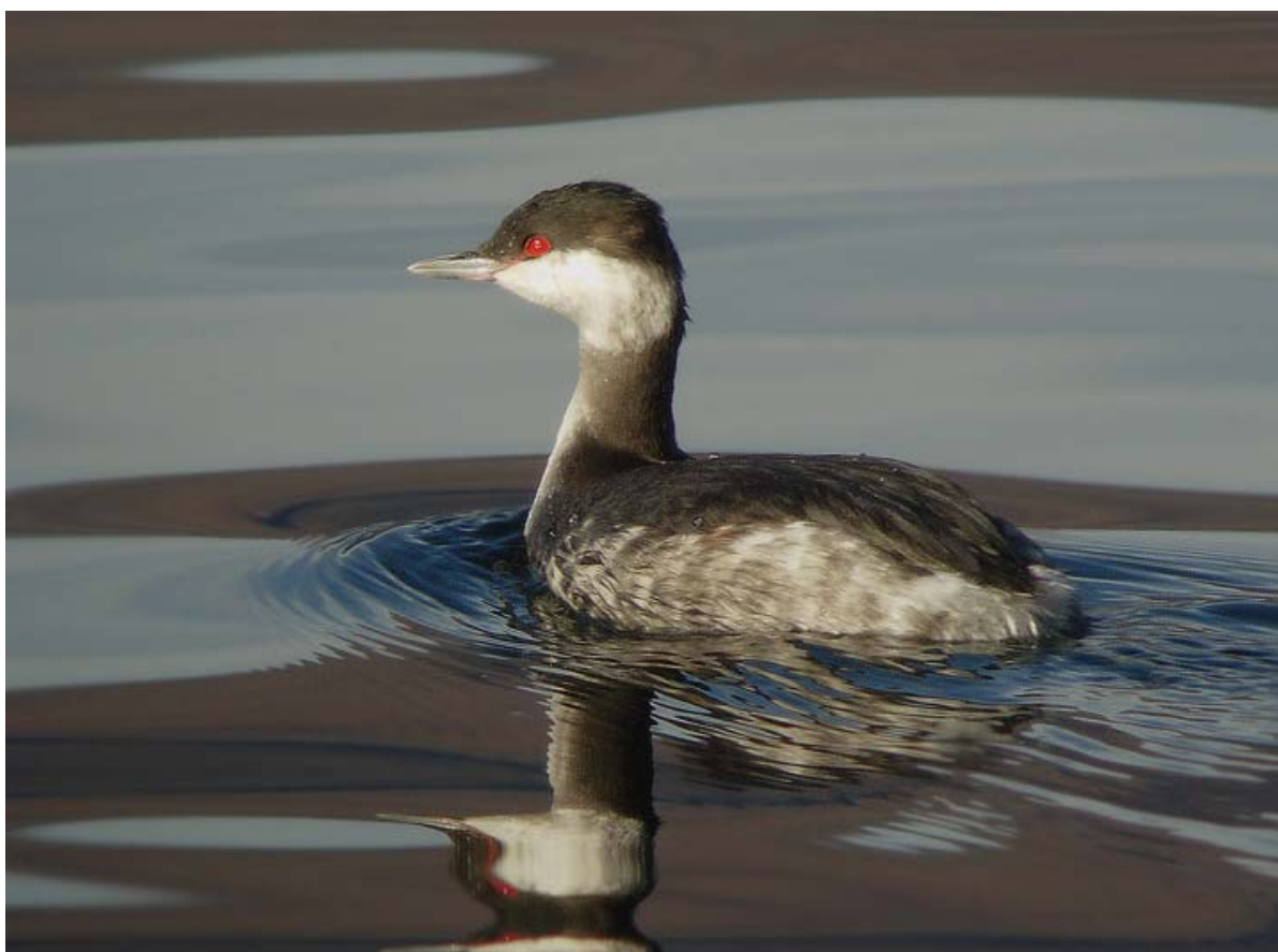
Svasso cornuto, Lago Maggiore (VA0402), gennaio 2008