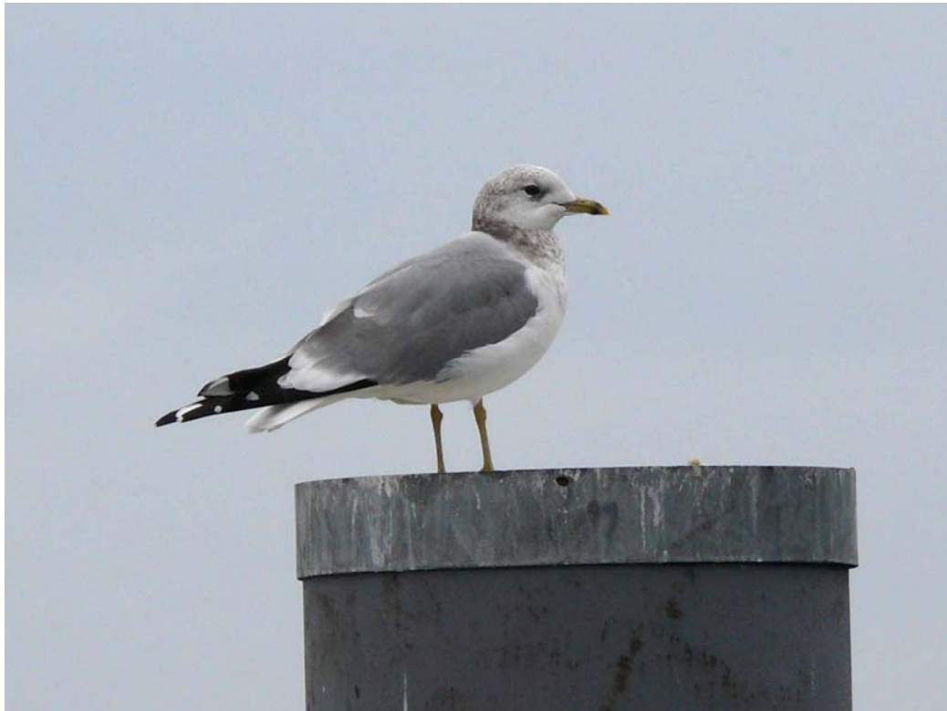
Gavina, Alto Lago di Garda (BS0101), gennaio 2008