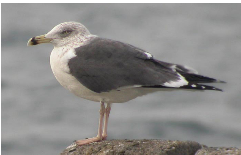
Zafferano, Lago Maggiore (VA0402), gennaio 2004