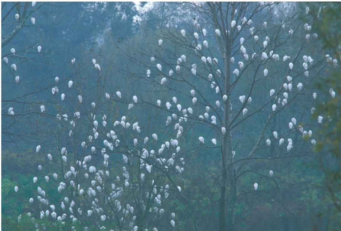
Dormitorio di Ardeinae, Basso Mincio (MN0600)

Vigorita V, Fasola M, Massa R, Tosi G 2003. Rapporto sullo stato di conservazione della fauna selvatica (Uccelli e Mammiferi) in Lombardia . Regione Lombardia, Milano.