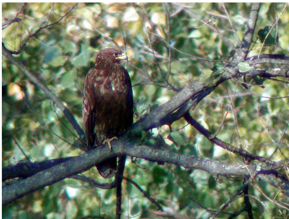
Aquila anatraia maggiore , AFV C.na Villarasca (PV0202), ottobre 2003