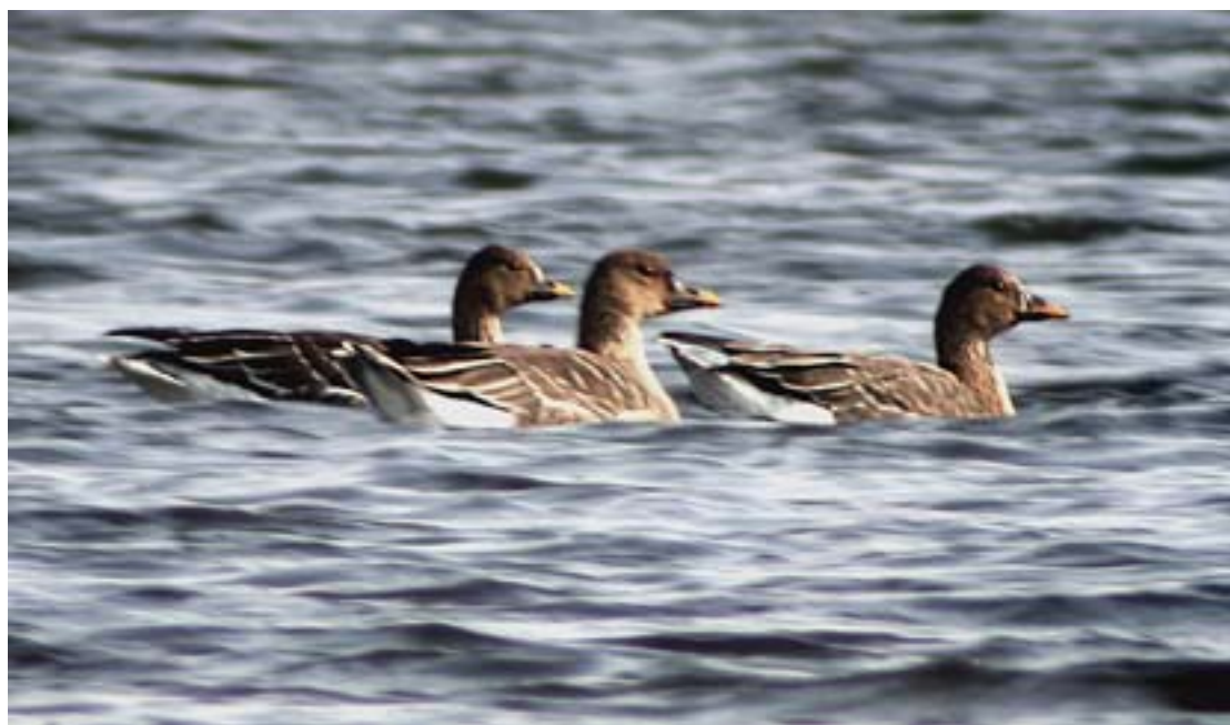
Oche granaiole della taiga, Laghetto del Frassino (BS0105), gennaio 2003