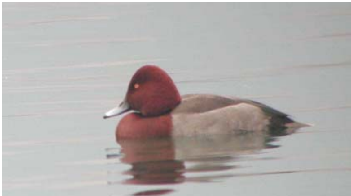
Maschio di presunto ibrido Moretta tabaccata x Moriglione, Lago di Olginate (CO0107), gennaio 2003