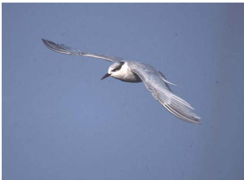
Mignattino piombato, Basso Lago di Garda (BS0103), gennaio 2003